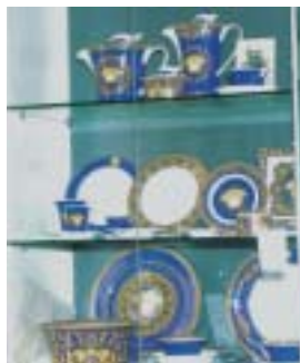
Empfindliches Porzellan der gehobenen Preisklasse ... ... muss behutsam bewegt werden, sonst ...

Das gab es noch nie in diesem hochsensiblen Bereich des Einzelhandels!